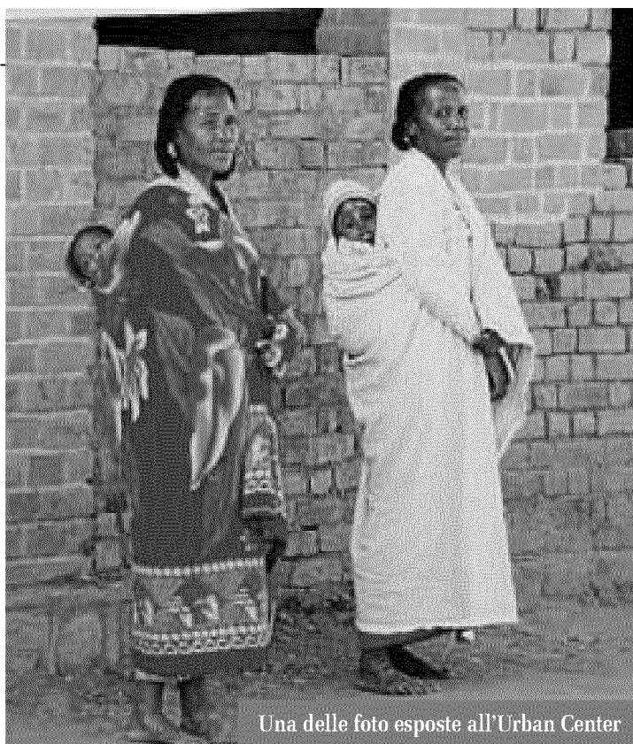
Una delle foto esposte all'Urban Center